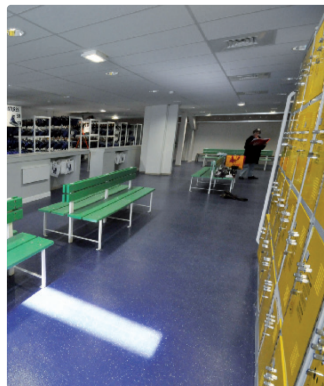
Local de location des patins

Un accueil soigné. Une salle de détente est à disposition. Joutant le bar L'Escale et dotée de distributeurs de boissons, elle offre une halte appréciée des parents et des patineurs.