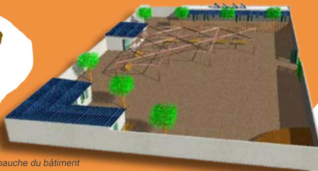
Ébauche du bâtiment

Située à 50 km de la capitale régionale Mopti, Konna est une ville carrefour du Niger, riche d'un remarquable patrimoine culturel.